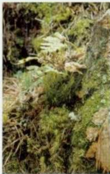
Farn, Mosa und Flechten - Fels, moos e lichens

→ Infolge dieses kühlen Klimas gedeihen hier auf etwa 500 Metern Meereshöhe Pflanzen, die sonst nur in wesentlich höheren alpinen Regionen zu finden sind. Die Vegetationsabfolge ist hier umgekehrt: an der Basis des Kessels gedeihen kälteresistente, am Oberrand wärmebedürftige Pflanzen. Auf engstem Raum findet man so eine große Vielfalt von über 600 Pflanzenarten. → Per il clima fresco, a ca. 500 m, crescono piante che normalmente vegetano in regioni alpine a quota molto più elevata. Le fasce vegetazionali qui sono capovolte: sul fondo della conca crescono piante resistenti al freddo, sul bordo piante che amano il caldo. Si trova così una grande varietà di specie di piante (oltre 600).