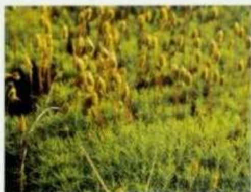
Hieracium - Muck

↑ Das seltene Naturphänomen der Eislöcher erklärt man mit dem physikalischen Prinzip der Windröhre: Luft strömt durch ein Spaltensystem zwischen den Porphyrböcken des Bergsturzes der Ganda von oben nach unten und kühlt sich dabei ab. Die schwere kalte Luft bleibt als Kaltluftsee von etwa fünf Metern Höhe in der Mulde liegen.