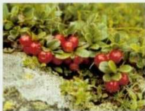
Podalium - Mottöll nuss