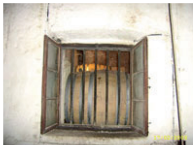
Detail der Kellerei