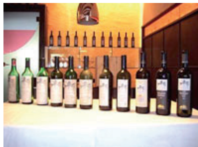
Die Protagonisten der Verkostung im März 2008

Am 31. März 2008 fand in den Verkostungsräumen der Kellerei Girlan eine außergewöhnliche Veranstaltung statt. Es wurden 12 Jahrgänge des Vernatsch ‚Gschleier‘ verkostet. Der älteste Wein stammte aus dem Jahr 1976. Nun muss man wissen, dass der Vernatsch in den meis-