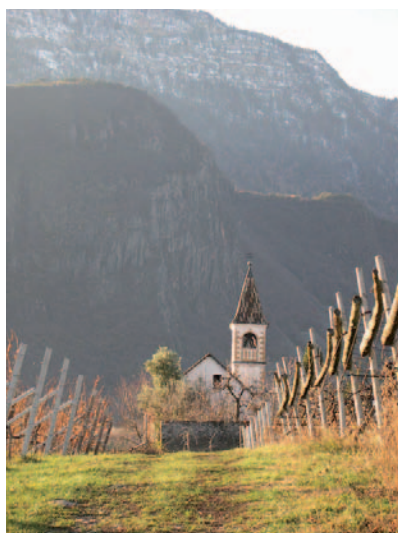
Der Kreithof

Der Kreithof gehört zu denjenigen Kellereien, die man kaum wahrnimmt, auch wenn man alle Präsentationsveranstaltungen inner- und außerhalb von Südtirol besucht. Und das sind nicht wenige, denn die Südtiroler zeigen gerne und oft, was sie zu bieten haben. Keine der wichtigen Messen ohne einen großen, gut organisierten Gemeinschaftsstand, mindestens eine Präsentation im Jahr in einer deutschen Stadt, die Bozner