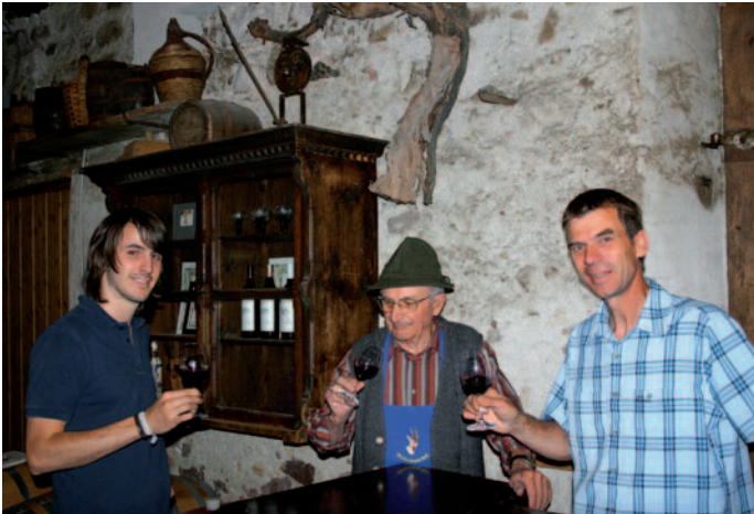
Drei Generationen der Familie Pichler

Die ausklingenden 70er Jahre waren in Südtirol eine lausige Zeit für viele Genossenschaftsmitglieder. Die Weinpreise und damit die Auszahlungen der Genossenschaften waren niedrig. Die meisten Weinbauern kannten jedoch erstens nichts anderes, als die Trauben bei der Genossenschaft oder bei einer Handelskellerei abzuliefern, und zweitens glichen die Einnahmen aus der Zimmervermietung und dem Obstanbau die mauen Einnahmen aus dem Traubenverkauf zumindest teilweise aus.